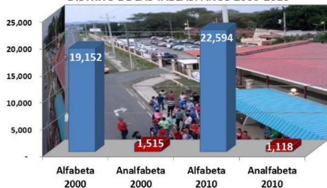
Gráfico No 2. NIVEL DE ALFABETIZACIÓN EN EL DISTRITO DE LAS TABLAS: AÑOS 2000-2010

En referencia al nivel de instrucción, en la provincia encontramos un total de 5,988 personas que no poseen ningún grado educativo, con educación primaria existen unas 40,883 personas, a nivel secundario 24,827 personas y con educación universitaria una 10,180 personas, en total. Por su parte en el distrito de Las Tablas encontramos un total de 1,449 personas que no poseen ningún grado educativo, con educación primaria existen unas 21,274 personas, a nivel secundario 7,796 personas y con educación universitaria 2,019 personas.