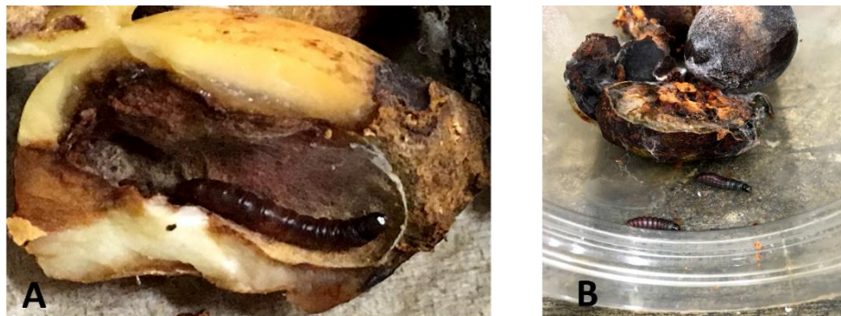
Fig. 3. A. Frutos de P. americana con larva de S. catenifer en su último estadio. B. Frutos de P. americana con larvas de S. catenifer en su último estadio, saliendo de la semilla para pupar fuera.

El daño causado por el insecto, se reconoció por la presencia de exudaciones en la entrada del orificio y coloraciones rojizas en el orificio de entrada de las galerías en los frutos y semillas (Figuras 3. A, B). Los ataques de la larva a los frutos de aguacate ocurrían generalmente, en las grietas, ranuras u orificios de los frutos, en zonas sombreadas bajo las ramas del mismo árbol, donde se encontraban los frutos distribuidos en sus ramas.