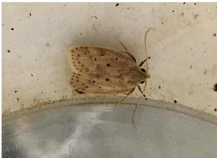
Fig. 5. Adultos de S. catenifer , nacidas en el laboratorio, recién emergida de la pupa que se encontraba dentro de la semilla en el laboratorio.

Los adultos emergidos (Figuras 5), se depositaron en recipientes “cámara letal” que contenían vapores de acetato de etilo ( C_4H_8O_2 ), para su posterior montado y etiquetado; luego se procedió a realizar su identificación en el Laboratorio de Entomología Sistemática, del Museo de Invertebrados G. B. Fairchild, de la Universidad de Panamá. Se utilizó el Manual de Procedimientos para la Prospección de Stenomoma catenifer Walsingham; editado por el personal de la Dirección de Análisis del Riesgo y Vigilancia Fitosanitaria, Servicio Nacional de Sanidad Vegetal, Perú, 2006; Boscán de Martínez – Godoy, 1985 . El parasitoide fue identificado con la ayuda del trabajo de Rouse, G. (2013).