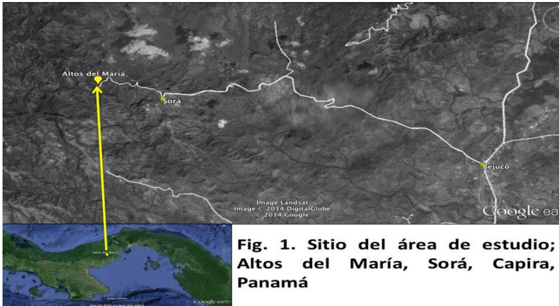
Fig. 1. Sitio del área de estudio; Altos del María, Sorá, Capira, Panamá