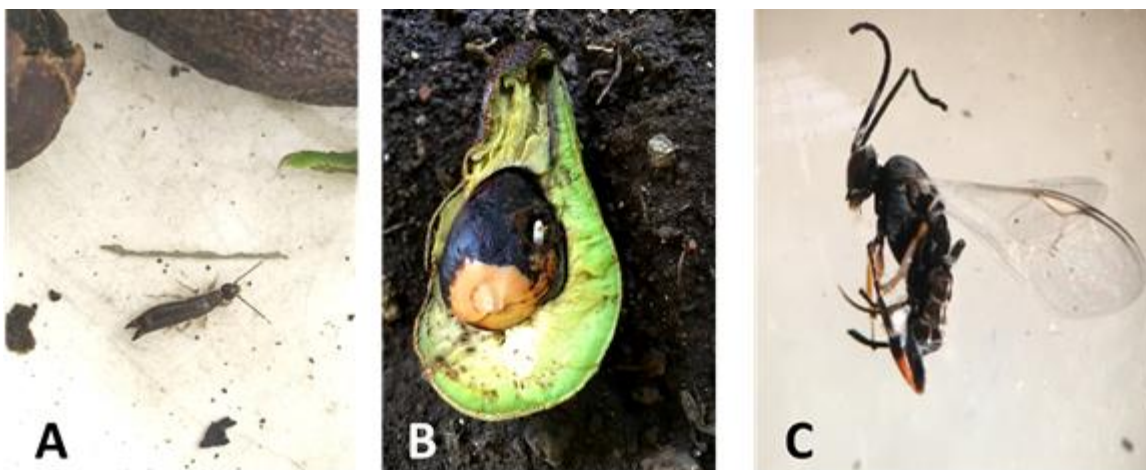
Fig. 7. A. Dermmaptera: Anisolabididae: Euborellia annulipes (Lucas 1847) posible depredador de larvas S. catenifer . B. Pupa en la semilla de aguacate de Braconidae: Glyptapanteles sp. C. Adulto de Braconidae: Glyptapanteles sp

En las observaciones se encontró enemigos naturales de S. catenifer , un depredador presente en el interior de 10 semillas de aguacate en el suelo, las semillas ya se encontraban en estado de putrefacción, 12 individuos del depredador identificado como Euborellia annulipes (Lucas, 1847) Dermaptera: Anisolabididae, en las semillas que se encontraba E. annulipes no se observó presencia de las larvas de la polilla S. catenifer (Figura 7. A).