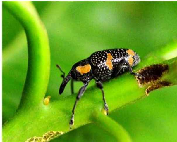
Fig 6. Defoliación por Heilipus trifasciatus (Fabricius), 1787 (Coleoptera: Curculionidae) en hojas y ramas de P. americana

De los 200 frutos que contenían cada árbol, un promedio de 80 frutos en cada árbol estaba invadido por larvas de la polilla del fruto del aguacate, lo que corresponde a 40% de la producción de cada árbol contenían larvas de S. catenifer (Figuras 2. A). Dentro de cada fruto se llegaron a recolectar hasta un máximo de dos larvas (Figuras 3. B), con un promedio de 120 larvas en frutos/árbol.