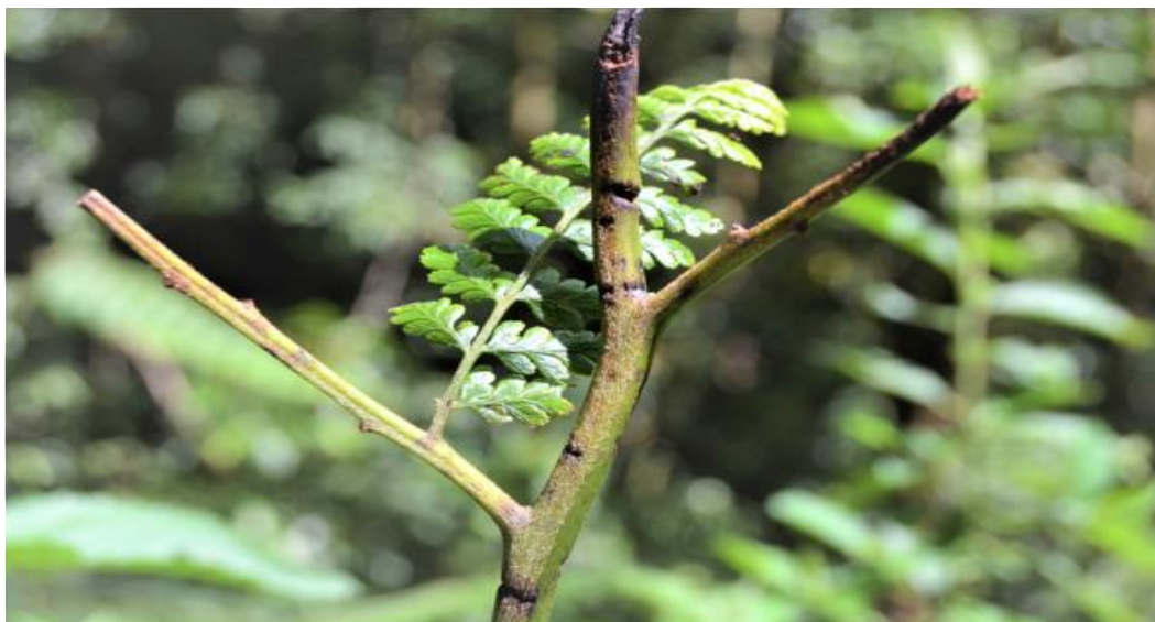
Fig. 4. Defoliación y lesiones en el raquis de M. torresiana .