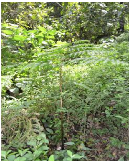
Fig. 2. Helecho Macrothelypteris torresiana (Gau.) Ching, 1963

Observamos dentro del bosque secundario en área de sombra, aproximadamente 65 lesiones a lo largo del raquis en las frondas de 23 plantas de M. torresiana , provocadas por M. armatus (Fig. 3, 4).