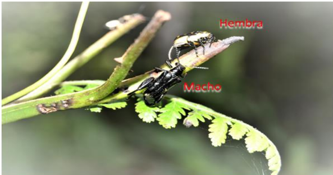
Fig. 5. Macho cortejando a la hembra de Megalopus armatus en el raquis de M. torresiana .

Los 4 especímenes fueron colectados en tres plantas del helecho M. torresiana ; estas plantas se encontraban en área de sombra dentro del bosque. Dato curioso, fue observar en la misma zona, 6 plantas ubicadas en área abierta fuera del bosque y no encontrar los escarabajos, ni observar las lesiones realizadas por ellos; las plantas de helecho se encontraban a la vista, completamente sanas.