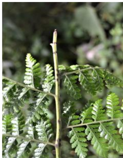
Fig. 3. Lesiones en el raquis de M. torresiana .