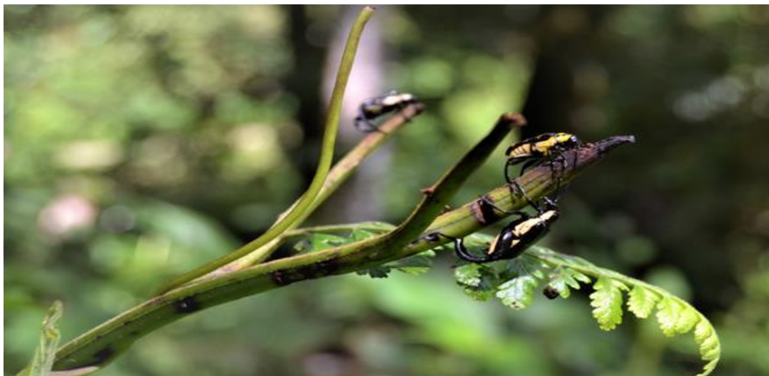
Fig. 6. parejas de Megalopus armatus alimentándose del raquis de M. torresiana .

La distribución en Panamá de M. armatus queda confinada sola para la Provincia de Chiriquí y en elevaciones superiores a los 500 msnm. Para la región del continente americano queda solamente para Panamá, Colombia y Venezuela (Rodríguez-Miron, 2018).